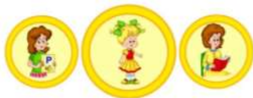
Схема взаимодействия учителя-логопеда и воспитателей