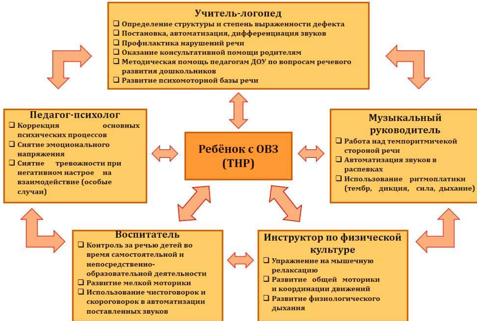
Схема взаимодействия участников коррекционного процесса МБДОУ «Иланский детский сад № 20»