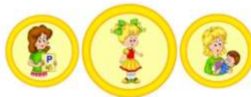
Схема взаимодействия учителя-логопеда и родителей