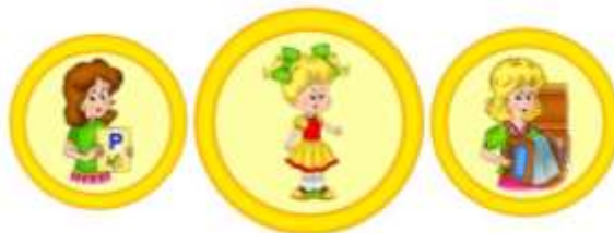
Схема взаимодействия учителя-логопеда и музыкального руководителя