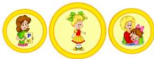
Схема взаимодействия учителя-логопеда и педагога-психолога