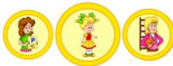
Схема взаимодействия учителя-логопеда и инструктора по физической культуре